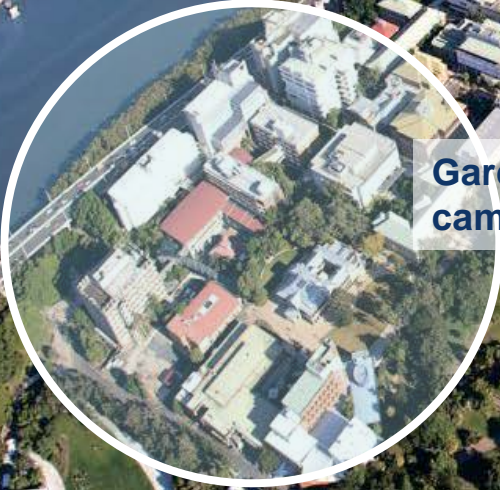
Gardens Point campus

La única universidad de Queensland con dos campus en el centro de la ciudad